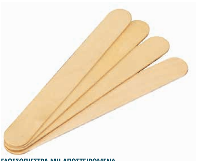
ΓΛΩΣΣΟΠΙΕΣΤΡΑ ΜΗ ΑΠΟΣΤΕΙΡΩΜΕΝΑ ΚΟΥΤΙ 500ΤΕΜ 21154