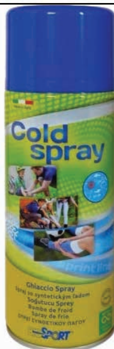
ΧΛΩΡΕΘΥΛΙΑ ΨΥΚΤΙΚΟ SPRAY 200ml 21087