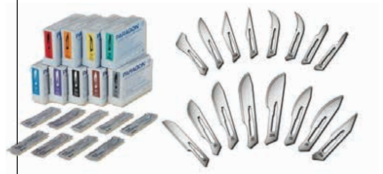
ΛΕΠΙΔΕΣ ΧΕΙΡΟΥΡΓΙΚΕΣ ΑΠΟΣΤΕΙΡΩΜΕΝΕΣ ΣΕ ΟΛΑ ΤΑ ΜΕΓΕΘΗ (ΑΠΟ Νο10-24) ΚΟΥΤΙ 100 ΤΕΜ 23060