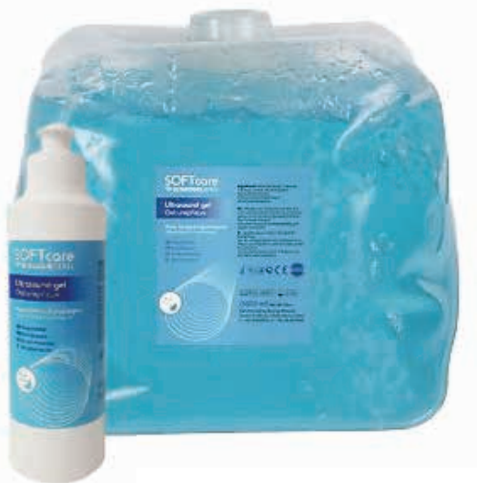
ΖΕΛΕ ΥΠΕΡΗΧΩΝ ΣΥΣΚ. 250gr 23438 ΖΕΛΕ ΥΠΕΡΗΧΩΝ ΣΥΣΚ. 5Kgr 23183