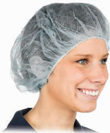
ΚΑΠΕΛΑ ΜΕ ΛΑΣΤΙΧΟ ΓΥΡΩ ΠΑΚ 100ΤΕΜ 23998