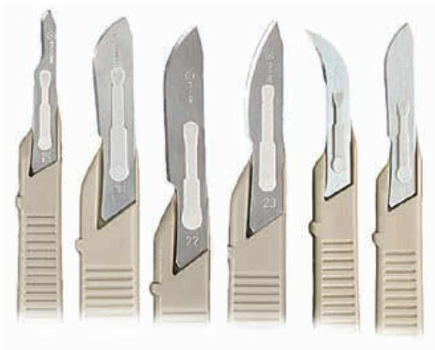
ΛΕΠΙΔΕΣ ΧΕΙΡΟΥΡΓΙΚΕΣ ΑΠΟΣΤΕΙΡΩΜΕΝΕΣ ΣΕ ΟΛΑ ΤΑ ΜΕΓΕΘΗ ΜΕ ΕΝΣΩΜΑΤΩΜΕΝΗ ΛΑΒΗ ΚΟΥΤΙ 100 ΤΕΜ