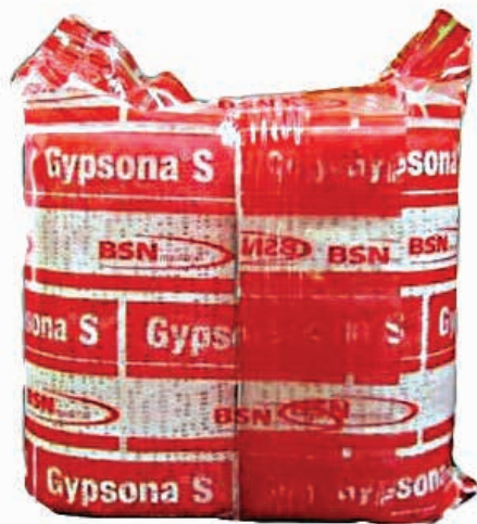
ΓΥΨΕΠΙΔΕΣΜΟΣ GYPSONA 5cmX2.7m 02227 ΓΥΨΕΠΙΔΕΣΜΟΣ GYPSONA 7.5cmX2.7m 02228 ΓΥΨΕΠΙΔΕΣΜΟΣ GYPSONA 10cmX2.7m 02229 ΓΥΨΕΠΙΔΕΣΜΟΣ GYPSONA 15cmX2.7m 02231