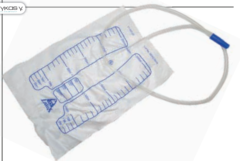
ΟΥΡΟΣΥΛΛΕΚΤΕΣ ΚΛΙΝΗΣ 2ΛΙΤ ΧΩΡΙΣ ΒΑΛΒΙΔΑ