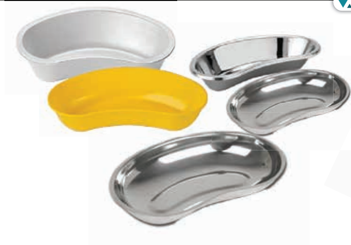
ΝΕΦΡΟΕΙΔΗ Μ.ΧΡ. ΦΕΛΙΖΟΛ