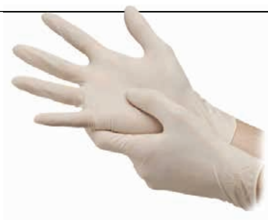
ΓΑΝΤΙΑ ΧΕΙΡΟΥΡΓΙΚΑ ΑΠΟΣΤΕΙΡΩΜΕΝΑ ΜΕ ΠΟΥΔΡΑ (ΜΕΓΕΘΗ 6, 6 1/2, 7, 7 1/2, 8, 8 1/2, 9) ΖΕΥΓΟΣ