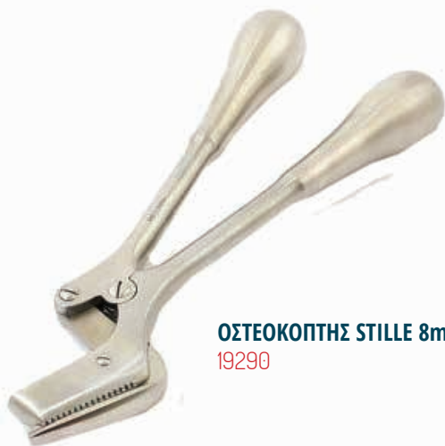
ΟΣΤΕΟΚΟΠΤΗΣ STILLE 8mm 23cm 19290