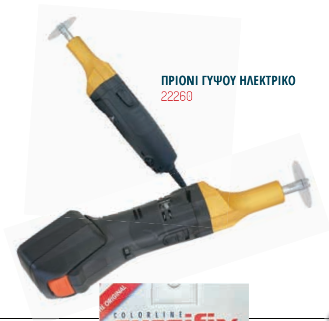
ΠΡΙΟΝΙ ΓΥΨΟΥ ΗΛΕΚΤΡΙΚΟ 22260