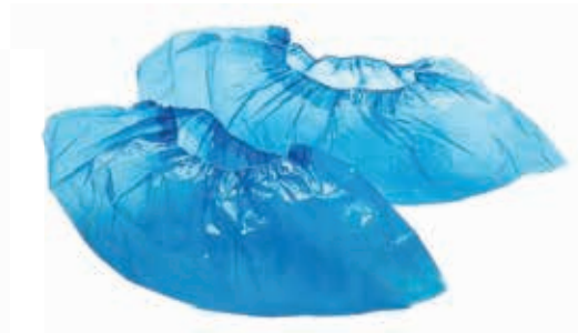
ΠΟΔΟΝΑΡΙΑ ΧΕΙΡΟΥΡΓΙΟΥ Μ.Χ. ΜΠΛΕ ΠΑΚ 100 TEM 23182