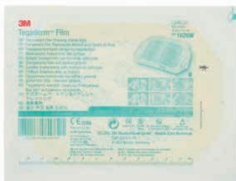
ΑΥΤΟΚΟΛΛΗΤΑ ΑΔΙΑΦΡΟΧΑ ΥΠΟΑΛΛΕΡΓΙΚΑ ΕΠΙΘΕΜΑΤΑ. TEGADERM 10 x 25 cm 02285