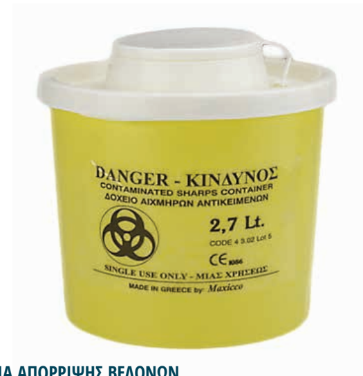
ΚΥΤΙΑ ΑΠΟΡΡΙΨΗΣ ΒΕΛΟΝΩΝ ΜΙΚΡΑ 2,7 LIT 18091