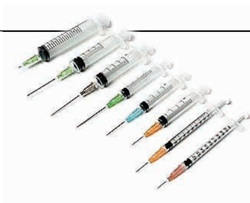
ΣΥΡΙΓΓΕΣ ΑΠΟΣΤΕΙΡΩΜΕΝΕΣ ΜΕ ΑΠΟΣΠΩΜΕΝΗ ΒΕΛΟΝΑ CHIRANA ΚΟΥΤΙ 100ΤΕΜ