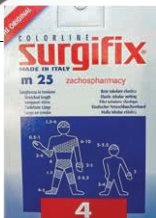
SURGI FIX No 1 ΔΙΧΤ.ΕΛΑΣΤ.ΕΠΙΔΕΣΜΟΣ 34701 02082 SURGI FIX No 2 ΔΙΧΤ.ΕΛΑΣΤ.ΕΠΙΔΕΣΜΟΣ 34702 02083 SURGI FIX No 3 ΔΙΧΤ.ΕΛΑΣΤ.ΕΠΙΔΕΣΜΟΣ 34703 02084 SURGI FIX No 4 ΔΙΧΤ.ΕΛΑΣΤ.ΕΠΙΔΕΣΜΟΣ 34704 02085 SURGI FIX No 5 ΔΙΧΤ.ΕΛΑΣΤ.ΕΠΙΔΕΣΜΟΣ 34705 02098 SURGI FIX No 6 ΔΙΧΤ.ΕΛΑΣΤ.ΕΠΙΔΕΣΜΟΣ 34706 02086 SURGI FIX No 7 ΔΙΧΤ.ΕΛΑΣΤ.ΕΠΙΔΕΣΜΟΣ 34707 02087 SURGI FIX No 8 ΔΙΧΤ.ΕΛΑΣΤ.ΕΠΙΔΕΣΜΟΣ 34708 02088 SURGI FIX No 9 ΔΙΧΤ.ΕΛΑΣΤ.ΕΠΙΔΕΣΜΟΣ 34709 02089