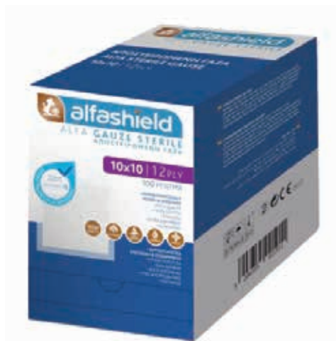
ΓΑΖΕΣ ΜΗ ΑΠΟΣΤΕΙΡΩΜΕΝΕΣ 10x20cm 03061 ΓΑΖΕΣ ΜΗ ΑΠΟΣΤΕΙΡΩΜΕΝΕΣ 10x10cm 03060 ΚΟΥΤΙ 100ΤΕΜ.