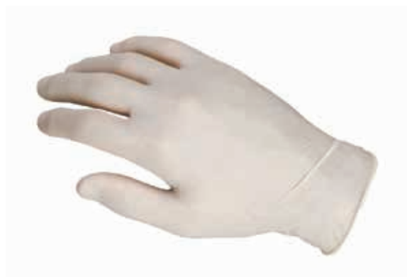
ΓΑΝΤΙΑ LATEX ΜΕ ΠΟΥΔΡΑ S-M-L ΚΟΥΤΙ 100 ΤΕΜ