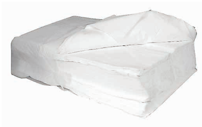
ΧΑΡΤΟΒΑΜΒΑΚΑΣ 5kg 23367