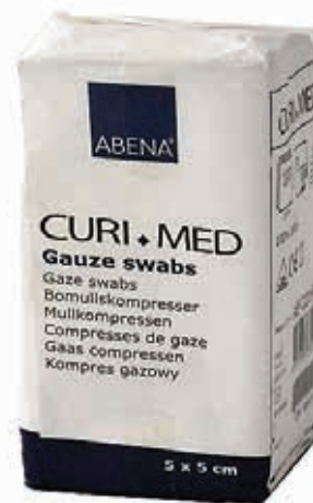
ΓΑΖΕΣ ΜΗ ΑΠΟΣΤΕΙΡΩΜΕΝΕΣ 5x5cm 03028 ΚΟΥΤΙ 100ΤΕΜ.