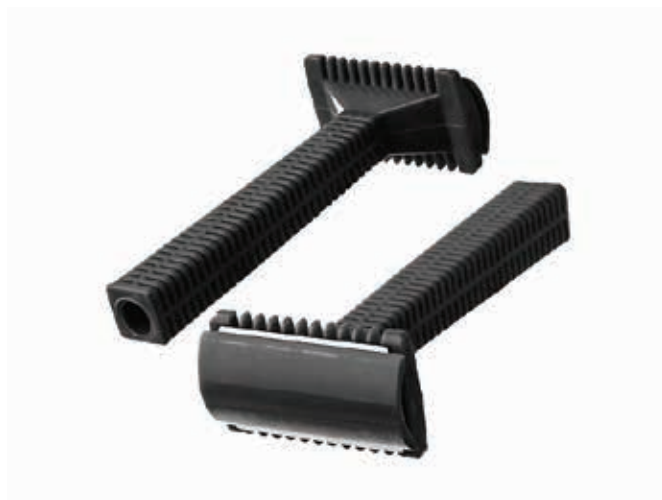
ΞΥΑΡΑΦΑΚΙΑ ΜΑΥΡΑ ΔΙΠΛΗΣ ΚΟΠΗΣ