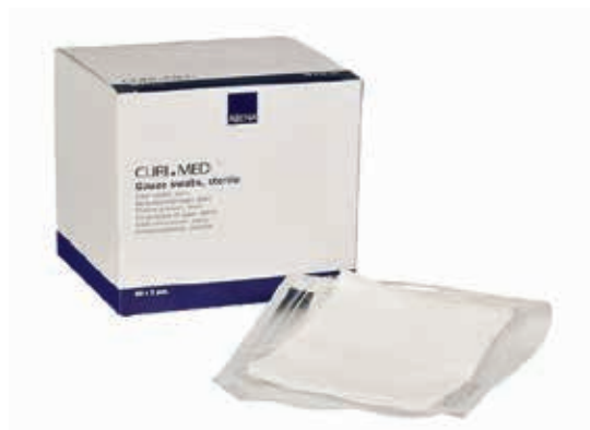
ΓΑΖΕΣ ΑΠΟΣΤΕΙΡΩΜΕΝΕΣ 36x40cm (10x10 ΔΙΠΛΩΜ. 12ply) ΚΟΥΤΙ 100 ΤΕΜ