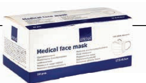
ΜΑΣΚΕΣ ΧΕΙΡΟΥΡΓΙΚΕΣ ΠΡΟΣΤΑΣΙΑΣ ΜΠΛΕ ΜΕ ΛΑΣΤΙΧΟ 50 ΤΕΜΑΧΙΩΝ ABENA 98% EN14683 TYPE IIR 23380-59