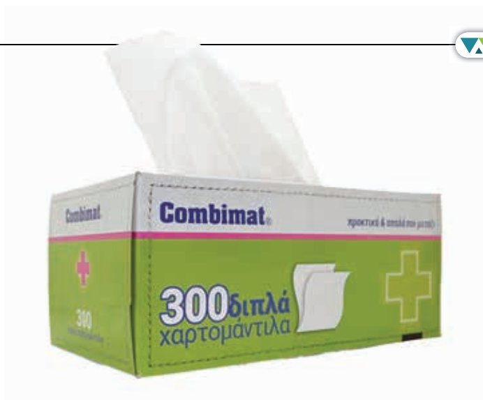
ΧΑΡΤΟΜΑΝΤΗΛΑ ΑΥΤΟΚΙΝΗΤΟΥ 90TEM 21973 ΧΑΡΤΟΜΑΝΤΗΛΑ ΑΥΤΟΚΙΝΗΤΟΥ 300TEM 21983•