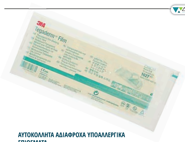
ΑΥΤΟΚΟΛΛΗΤΑ ΑΔΙΑΦΡΟΧΑ ΥΠΟΑΛΛΕΡΓΙΚΑ ΕΠΙΘΕΜΑΤΑ. TEGADERM 10 x 12 cm 02286