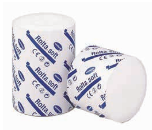
ΟΡΘΟΠΕΔΙΚΟΣ ΕΠΙΔΕΣΜΟΣ ROLTA SOFT 6cm 02160 ΟΡΘΟΠΕΔΙΚΟΣ ΕΠΙΔΕΣΜΟΣ ROLTA SOFT 10cm 02166 ΟΡΘΟΠΕΔΙΚΟΣ ΕΠΙΔΕΣΜΟΣ ROLTA SOFT 15cm 02167