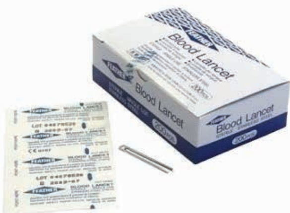
ΛΑΝΣΕΤΕΣ ΑΙΜΟΛΗΨΙΑΣ ΚΟΥΤΙ 200 ΤΕΜ. 23121