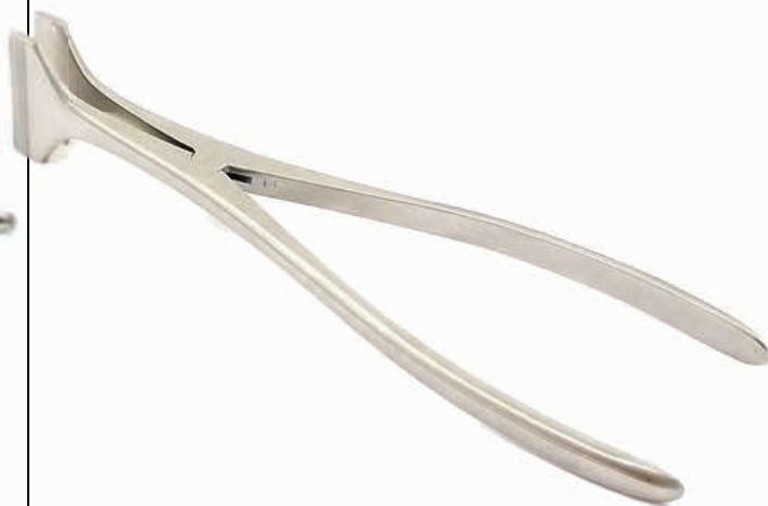
ΔΙΑΣΤΟΛΕΑΣ ΓΥΨΟΥ HENNING 26cm 19130