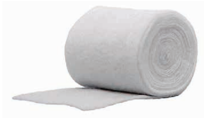
ΒΑΜΒΑΚΙ ΥΔΡΟΦΥΛΛΟ 1000gr 23999 ΒΑΜΒΑΚΙ ΥΔΡΟΦΥΛΛΟ 150gr 23075 ΒΑΜΒΑΚΙ ΥΔΡΟΦΥΛΛΟ 70gr 23074