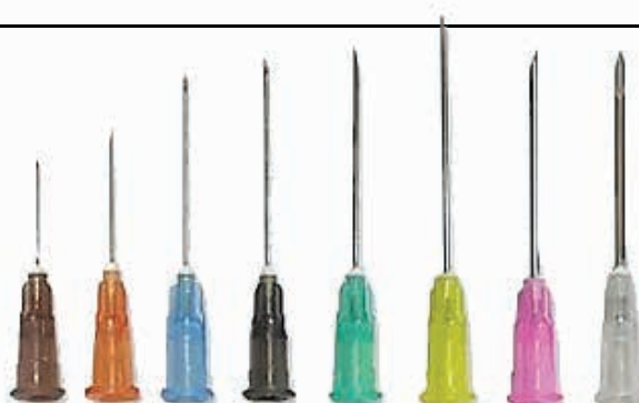
ΒΕΛΟΝΕΣ ΑΠΟΣΤΕΙΡΩΜΕΝΕΣ NIPRO 19G x 1 ½ (1.1x40mm) ΚΙΤΡΙΝΟ 21G x 1 ½ (0.80x40mm) ΠΡΑΣΙΝΟ 23G x 1" (0.6x25mm) ΜΠΛΕ 25G x ½ (0.45x12mm) ΚΑΦΕ 27G x ¾ (0.40x20mm) ΓΚΡΙ ΚΟΥΤΙ 100ΤΕΜ 08010