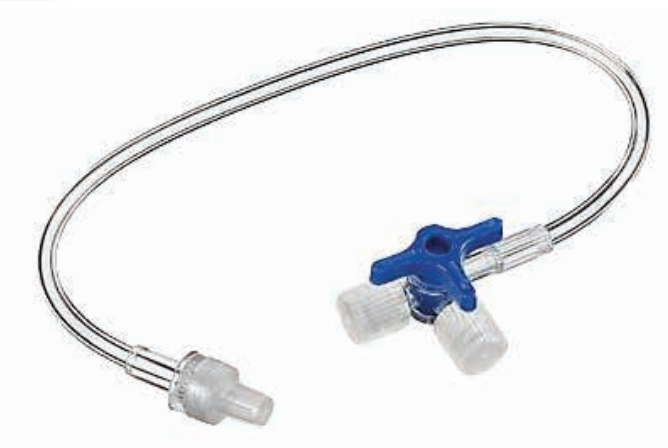
ΣΥΝΔΕΤΙΚΟ 3WAY+ΠΡΟΕΚ.10 cm 30208