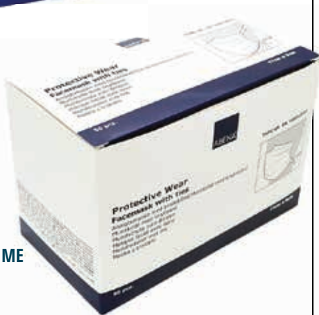
ΜΑΣΚΕΣ ΠΡΟΣΤΑΣΙΑΣ ΜΕ ΚΟΡΔΟΝΙΑ ΔΕΤΕΣ ΚΟΥΤΙ 50 TEM 23101-01