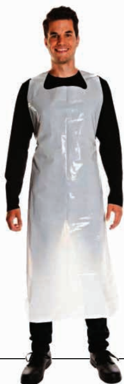
ΠΟΔΙΕΣ ΠΛΑΣΤΙΚΕΣ Μ.ΧΡ. 23179