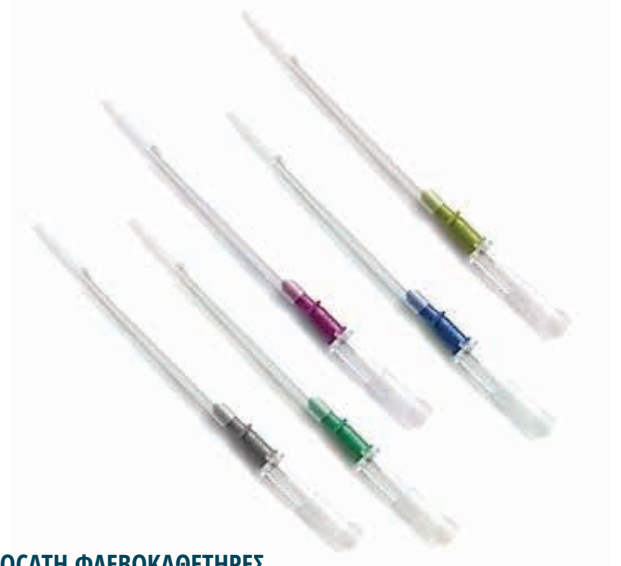
ΑΒΒΟCΑΤΗ ΦΛΕΒΟΚΑΘΗΤΗΡΕΣ 24 Ch (ΠΑΙΔΙΚΟΙ) 05218 14 - 22 Ch 05205