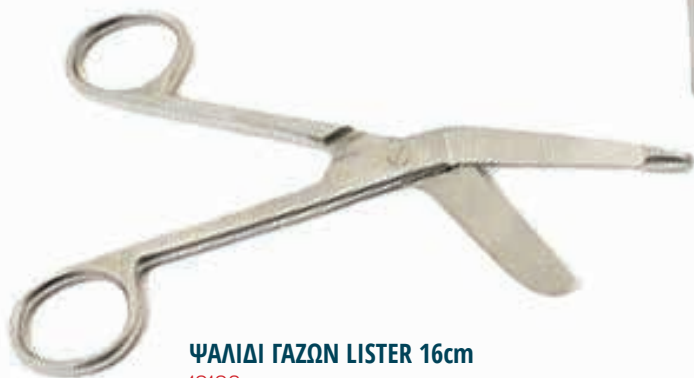
ΨΑΛΙΔΙ ΓΑΖΩΝ LISTER 16cm 19198