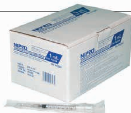
ΣΥΡΙΓΓΕΣ ΑΠΟΣΤΕΙΡΩΜΕΝΕΣ NIPRO ΜΕ ΑΠΟΣΠΩΜΕΝΗ ΒΕΛΟΝΑ ΚΟΥΤΙ 100ΤΕΜ