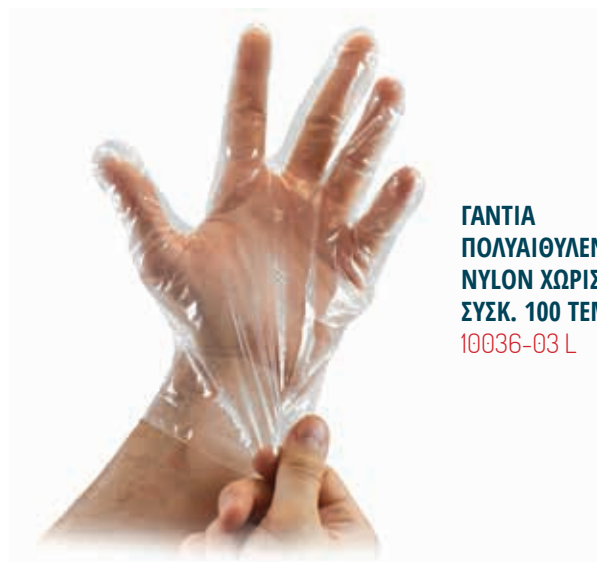
ΓΑΝΤΙΑ ΠΟΛΥΑΙΘΥΛΕΝΙΟΥ (PE) ΝΥΛΟΝ ΧΩΡΙΣ ΤΑΛΚ ΣΥΣΚ. 100 ΤΕΜ