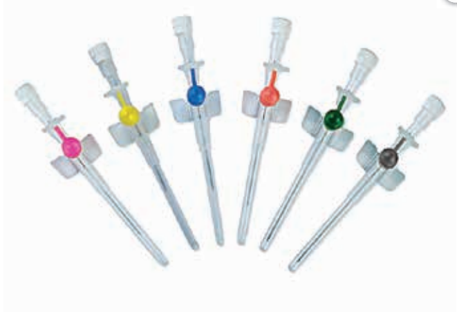
ΦΛΕΒΟΚΑΘΗΤΗΡΕΣ ΜΕ ΒΑΛΒΙΔΑ + ΦΤΕΡΑ 16-22 Ch 05013 24 Ch 05165