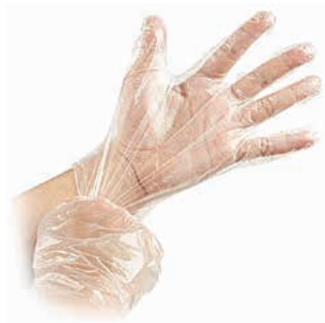
ΓΑΝΤΙΑ VINYL ΕΛΑΦΡΩΣ ΠΟΥΔΡΑΡΙΣΜΕΝΑ S-M-L ΚΟΥΤΙ 100 ΤΕΜ