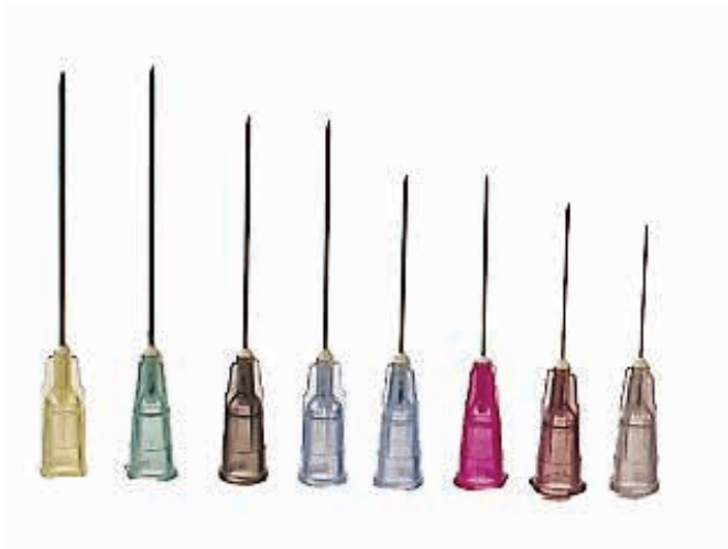
ΒΕΛΟΝΕΣ ΑΠΟΣΤΕΙΡΩΜΕΝΕΣ BD 30G x ½ (0.3x13mm) ΚΙΤΡΙΝΟ ΚΟΥΤΙ 100ΤΕΜ 08011