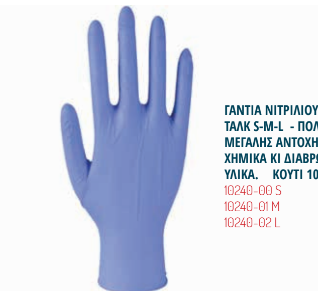
ΓΑΝΤΙΑ ΝΙΤΡΙΛΙΟΥ ΧΩΡΙΣ ΤΑΛΚ S-M-L - ΠΟΛΥ ΜΕΓΑΛΗΣ ΑΝΤΟΧΗΣ ΣΕ ΧΗΜΙΚΑ ΚΙ ΔΙΑΒΡΩΤΙΚΑ ΥΛΙΚΑ. ΚΟΥΤΙ 100 ΤΕΜ