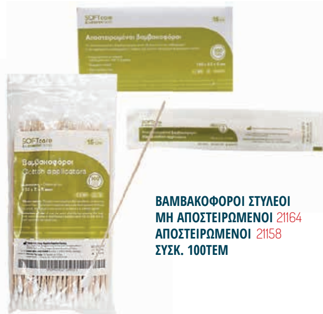
ΒΑΜΒΑΚΟΦΟΡΟΙ ΣΤΥΛΕΟΙ ΜΗ ΑΠΟΣΤΕΙΡΩΜΕΝΟΙ 21164 ΑΠΟΣΤΕΙΡΩΜΕΝΟΙ 21158 ΣΥΣΚ. 100TEM