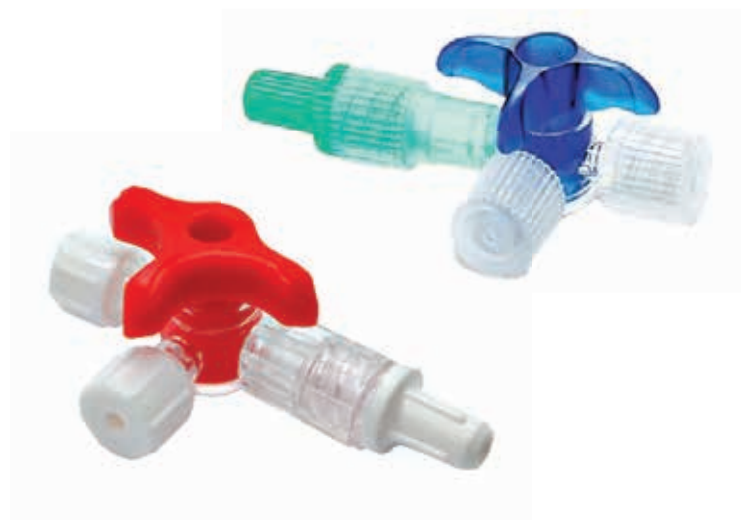
ΣΥΝΔΕΤΙΚΟ 3-WAY 120902