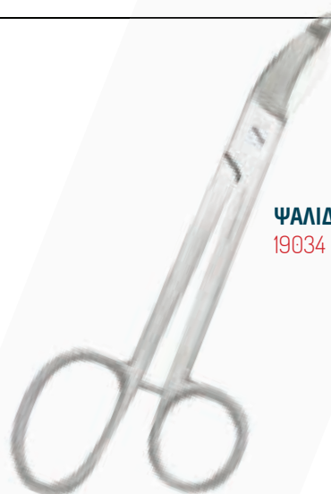
ΨΑΛΙΔΙ ΓΥΨΟΥ 24cm 19034