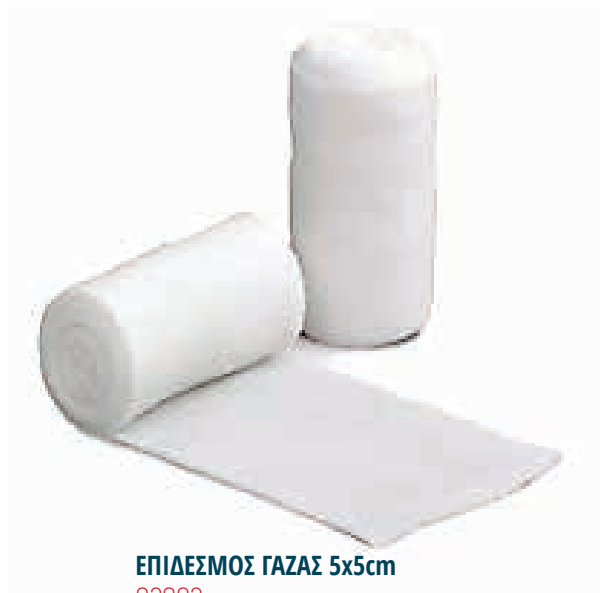
ΕΠΙΔΕΣΜΟΣ ΓΑΖΑΣ 5x5cm 02002